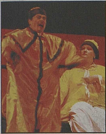
Une chinoiserie musicale signée Offenbach.